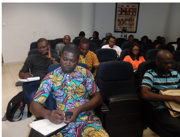
les médias, les partenaires et les sponsors