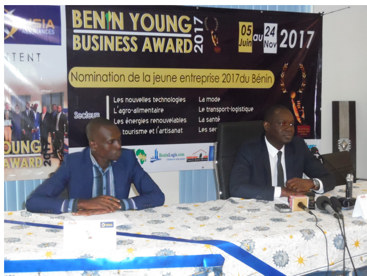
Le Promoteur du BYBA et le Sponsor Officiel